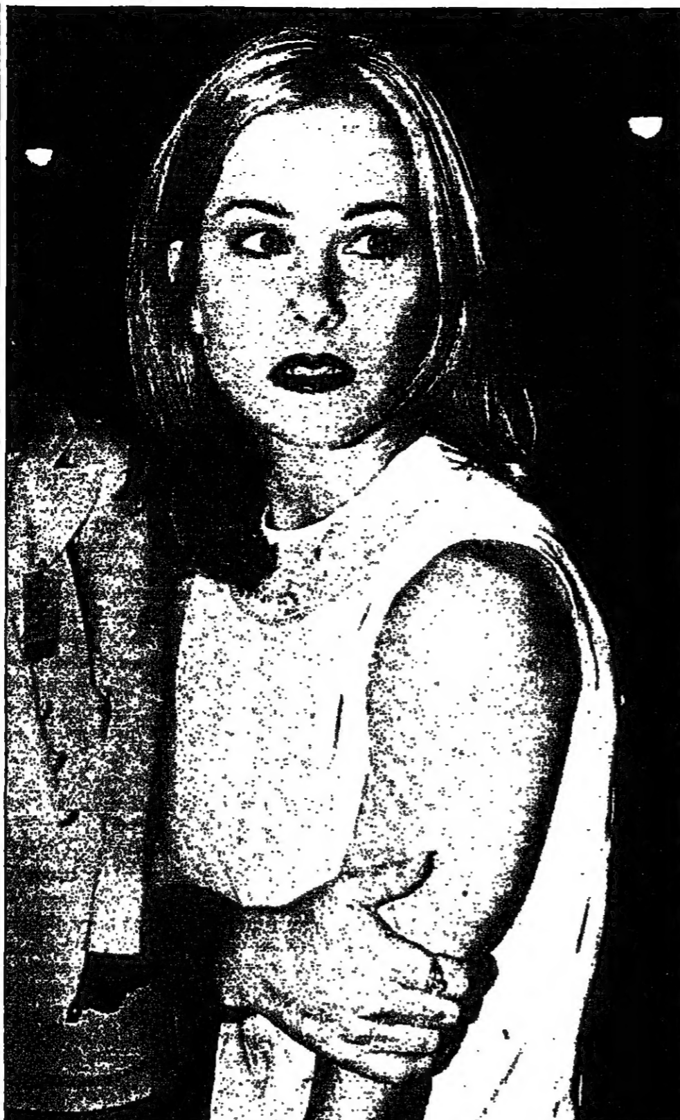
الجميلة كريستينا أيليفيت الممثلة في فيلم «الجمال» الذي شاركته في مهرجان كان السينمائي

الرياض - ق. ن.: ربطت دراسة طبية بين الإصابة بمرض تليف الرئة والتدخين، وتعتبر أن غالبية الأشخاص المصابين بتليف الرئة إما أنهم يدخنون أو كانوا يدخنون السجائر. وأوضحت الدراسة التي أجراها مستشفى الملك فيصل التخصصي ومركز الأبحاث ونشرت هنا أن عدد الأشخاص المعرضين للإصابة بتليف الرئة في أزيد من 100 ألف شخص في كل سنة، وتنبهت إلى أن هذا المرض يصيب الأشخاص على مختلف أعمارهم لكن مرض تليف الرئة يصيب مرضى غيرهم للإصابة بالمرض الذي يصيب الكبد والبنكرياس والبنكرياس. وأكدت الدراسة أن مرض تليف الرئة غير معد مسما أنه ليس شكلا من أشكال السرطان. والفرضيات التي تقول الرئة عبارة عن مرض تسبب فيه خضابا تكون مصدرة عادة من دفاع الجسم ضد الانتهاكات غير أنها بدلاً من ذلك تسبب في حدوث التهاب وادى وتوقف وتلف في الرئتين.